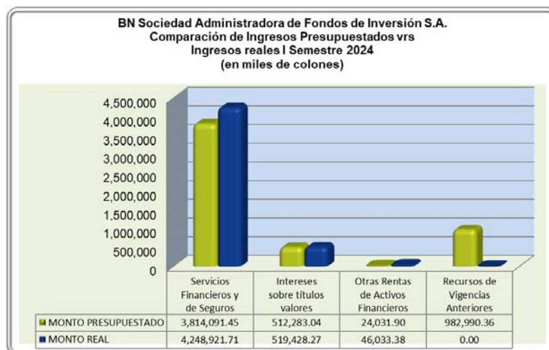
GRAFICO N° 1

El presupuesto de los egresos para el primer semestre del 2024 asciende a ¢5,245.76 millones. Los gastos totales se ejecutaron en un 86.37%, lo que equivale a un monto de ¢4,530.67 millones para el primer semestre, es decir, se presenta una sub-ejecución de un 13.63% sobre el monto del presupuesto semestral de egresos, lo cual obedeció al control del gasto y uso racional de los recursos. El siguiente cuadro revela la composición de los egresos en el período.