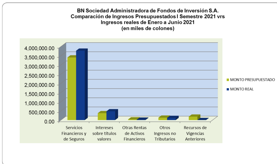
GRAFICO N° 2

En el siguiente gráfico se visualiza el comportamiento de los ingresos presupuestados versus los reales.